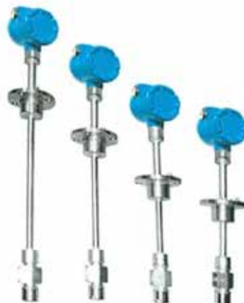
Рисунок 2 - Общий вид датчиков расхода ДРС модификации ДРС.3