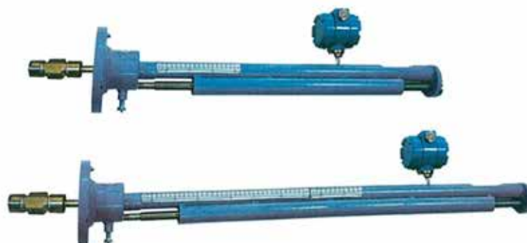
Рисунок 3 - Общий вид датчиков расхода ДРС модификации ДРС.3(Л)