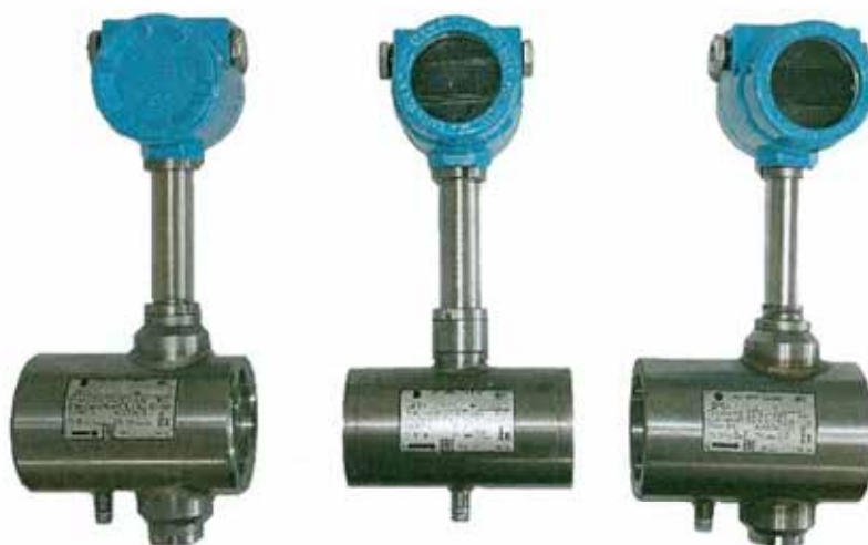
Рисунок 1 - Общий вид датчиков расхода ДРС модификации ДРС

Пломбировка от несанкционированного доступа датчиков расхода ДРС осуществляется нанесением знака поверки давлением на специальную мастику, установленную в чашечке винта крепления платы индикации или защитного экрана, расположенных под передней крышкой электронного преобразователя. Схема пломбировки от несанкционированного доступа, обозначение места нанесения знака поверки представлены на рисунке 4.